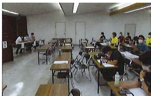
島根県青協との意見交換

一方で、要請活動等のツールとしては、毎年10月頃に開かれる全国会議において、本県選出の国会議員を訪問しポリシーブックを基に要請活動を実施したり、JA関係組織や県知事、県農林水産部の幹部職員、中国四国農政局との意見交換の資料として提出・活用し、ポリシーブックにまとめた盟友の声を国・県へ伝えています。