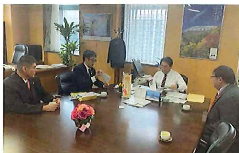
国会議員への要請活動 直接青年部の声を届ける