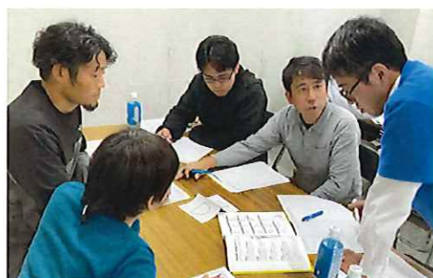
事業承継について研修