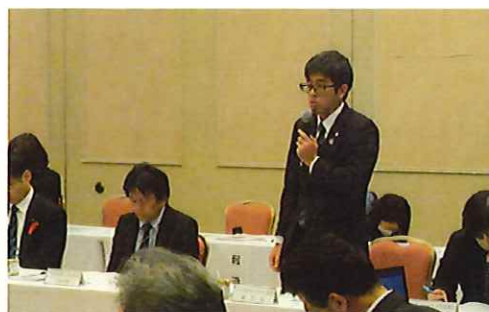
県知事との農政懇談会 委員長から直接知事に要望